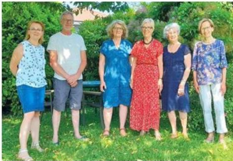
Les membres du bureau de l'Association chablaisienne l'école à l'hôpital.

Dans le Chablais, l'Association chablaisienne l'école à l'hôpital (ACEH) a été créée il y a 20 ans. Elle est agréée par l'Éducation nationale et fait partie du réseau national de la FEMDH (Fédération pour l'enseignement des malades à domicile et à l'hôpital). Le dispositif Apadhe, placé sous la responsabilité du directeur d'académique de service de l'Éducation nationale (Dasen),